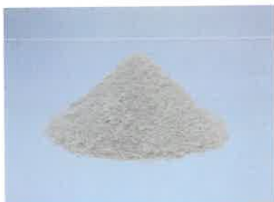
リサイクルされた石膏